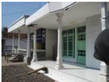
Gambar 4a. Rumah modern di Desa Kalibuntu

Rumah yang masih khas di Desa Kalibuntu memiliki tipologi arsitektur dengan susunan simetris baik fasad maupun tata ruang dalamnya. Susunan simetris pada fasad terlihat dari tatanan pintu dan jendela dimana pintu terletak di tengah antara dua jendela. Atap menggunakan atap limasan, pelana dan terompesan Madura. Sudut kemiringan atap limasan yang digunakan kebanyakan kecil hampir mendekati datar, sedangkan untuk atap pelana biasanya menggunakan atap pelana dengan sosoran. Rumah di Desa Kalibuntu memiliki ciri lain yaitu menggunakan tiang penyokong di depan rumah. Tiang ini memiliki fungsi sebagai penopang beban bangunan dan beban angin yang berhembus dari laut, selain itu juga berfungsi sebagai estetika bangunan. Terdapat serambi atau teras depan yang berfungsi sebagai ruang publik yaitu tempat untuk berkumpul, mengobrol atau bercengkrama dengan tetangga, serambi ini memberikan kesan keterbukaan dan keramahan antar warga. Pola atau tata ruang dalam rumah khas Desa Kalibuntu sangat sederhana yaitu terdiri dari: