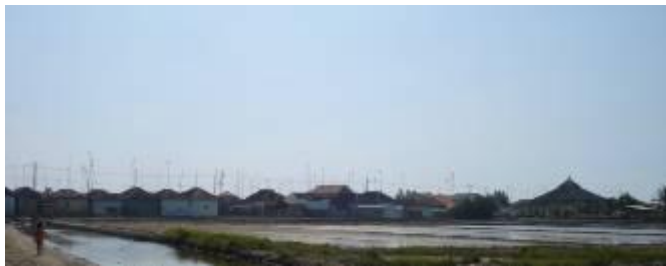
Gambar 8. Tampak pola linier yang terbentuk di Desa Kalibuntu

membangun rumah di belakang rumah yang telah terbangun. Rumah yang dibangun dibelakang rumah yang sudah ada disebut rumah lapis kedua. Seiring berjalannya waktu dengan banyaknya penduduk pendatang pola permukiman nelayan di Desa Kalibuntu menjadi pola cluster atau acak.