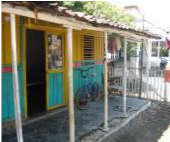
Gambar 3d. Rumah yang masih khas di Desa Kalibuntu