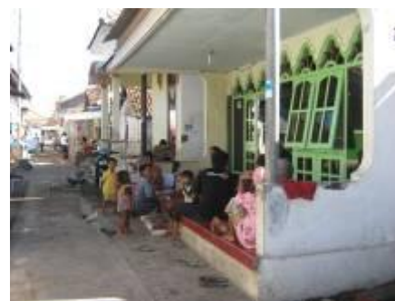
Gambar 7b. Ruang publik penduduk