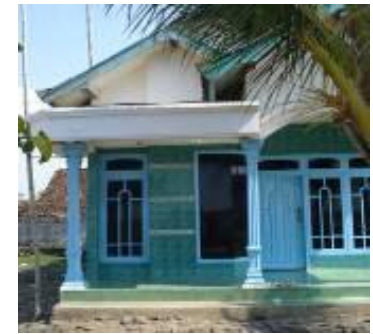
Gambar 4d. Rumah modern di Desa Kalibuntu