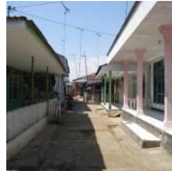
Gambar 1b. Sirkulasi yang terbentuk dari pola rumah yang saling berhadapan