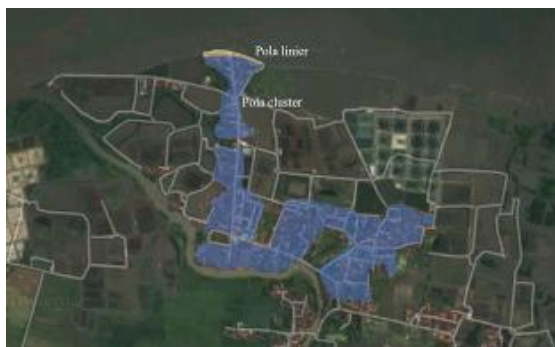
Gambar 9. Klasifikasi zona permukiman nelayan Desa Kalibuntu berdasarkan pola permukiman

Permukiman yang semakin menjauh dari pesisir pantai, karakter permukiman pesisirnya akan semakin hilang dan semakin berkurang ruang untuk aktifitas nelayan. Klasifikasi zona permukiman nelayan Desa Kalibuntu berdasarkan pola permukiman dapat dilihat di gambar 9. Pola permukiman nelayan Desa Kalibuntu di pengaruhi oleh nilai-nilai kekerabatan, sosial dan budaya nelayan Desa Kalibuntu tercermin atau terimplementasi secara fisik dalam kawasan dan lokasi dan kondisi alam daerah pesisir.