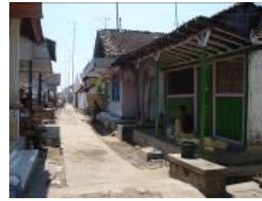
Gambar 1a. Sirkulasi yang terbentuk dari pola rumah yang saling berhadapan

“Rumah adalah wadah untuk menampung aktivitas, karenanya di dalam dan di sekitar rumah diharapkan dapat berlangsung “aktivitas kehidupan” yang bermanfaat dan kontinyu.” (Salura, 2001). Bagi para nelayan rumah merupakan salah satu sarana untuk pendukung aktifitas melaut. Masyarakat Kalibuntu memiliki pandangan bahwa rumah adalah tempat untuk bernaung, melindungi diri, dan melaksanakan kegiatan beragama dan melaut. Rumah nelayan di Desa Kalibuntu berorientasi ke arah datangnya angin atau laut, selain itu rumah-rumah di Desa Kalibuntu juga saling berhadap-hadapan dengan tetangga dan ruang yang terbentuk antar rumah difungsikan sebagai sirkulasi. Rumah saling bersebelahan dengan jarak antar rumah saling berhimpitan sehingga dapat memecah angin yang datang dari laut.