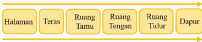
Gambar 5. Skema tata ruang dalam rumah di desa Kalibuntu