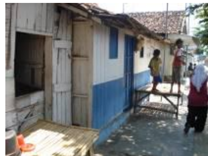
Gambar 7a. Ruang publik penduduk