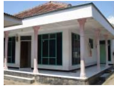
Gambar 4b. Rumah modern di Desa Kalibuntu