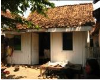
Gambar 3b. Rumah yang masih khas di Desa Kalibuntu