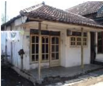
Gambar 3c. Rumah yang masih khas di Desa Kalibuntu