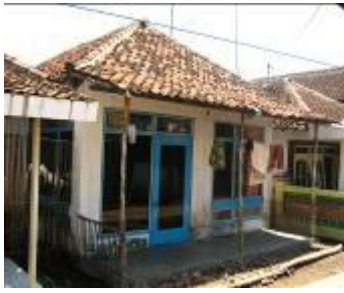
Gambar 3a. Rumah yang masih khas di Desa Kalibuntu