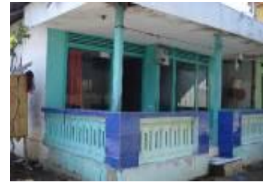
Gambar 4c. Rumah modern di Desa Kalibuntu