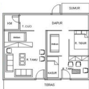
Gambar 6b. Contoh tata ruang dalam rumah di desa Kalibuntu