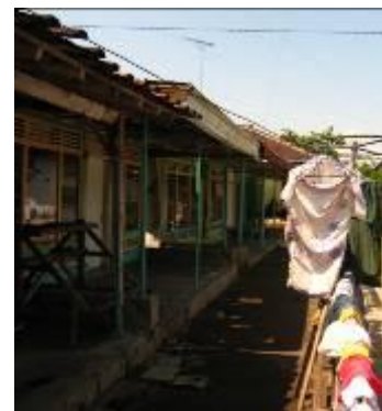
Gambar 2. Jarak rumah yang saling berhimpitan

Rumah tinggal di Desa Kalibuntu pada memiliki bentuk arsitektur yang khas namun seiring berkembangnya jaman banyak rumah yang direnovasi mengikuti gaya arsitektur modern seperti di perkotaan. Penduduk yang merenovasi rumahnya biasanya adalah penduduk dengan tingkat perekonomian tinggi. Rumah yang sudah bertransformasi ke arsitektur modern dengan rumah yang masih khas hanya berbeda dari segi fasad dan bahan material yang digunakan, sedangkan untuk tata ruang dalam kurang lebih sama.